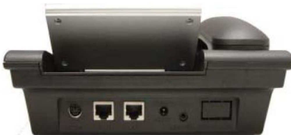
Pohled ze zadu